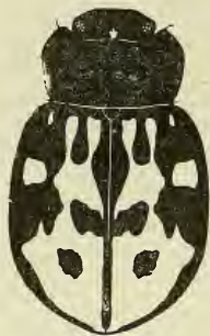
Fig. 1. Cryptostetha juanae n. sp.

Prothorax transversal, plus que deux fois aussi large que long, un peu cordiforme, ayant sa plus grande largeur avant le milieu et à côtés fortement arrondis avant le milieu. Angles antérieurs arrondis, les postérieurs presque droits. La fovéole sétigère postérieure se trouve un peu en avant aux côtés. Surface assez peu convexe, très finement et très éparsément ponctuée.